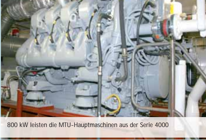
800 kW leisten die MTU-Hauptmaschinen aus der Serie 4000