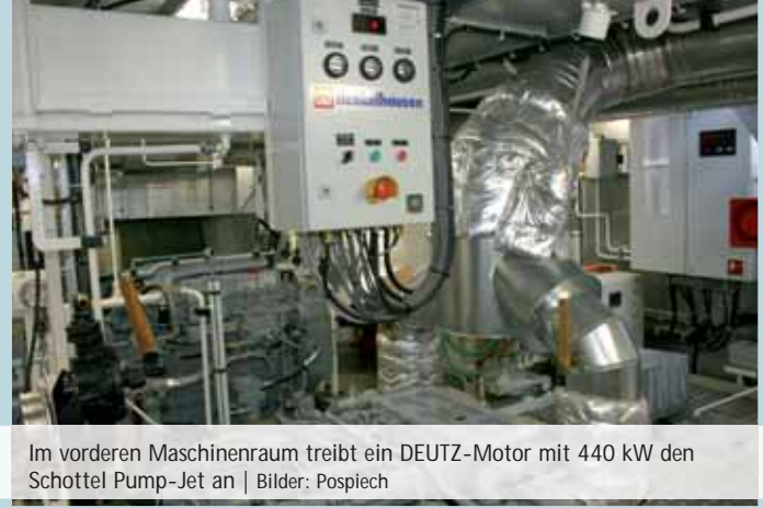
Im vorderen Maschinenraum treibt ein DEUTZ-Motor mit 440 kW den Schottel Pump-Jet an | Bilder: Pospiech

Klimaregelung für alle Räume. Für Sicherheit an Bord sorgt eine Feuerlöschanlage der Firma Tyco Marine. Das eingesetzte Löschmittel NOVEC 1230 arbeitet mittels chemischer Reaktion und entzieht den Menschen in den betroffenen Räumen keine Atemluft. Die PREMICON QUEEN ist das erste Schiff der Flotte, das über ein