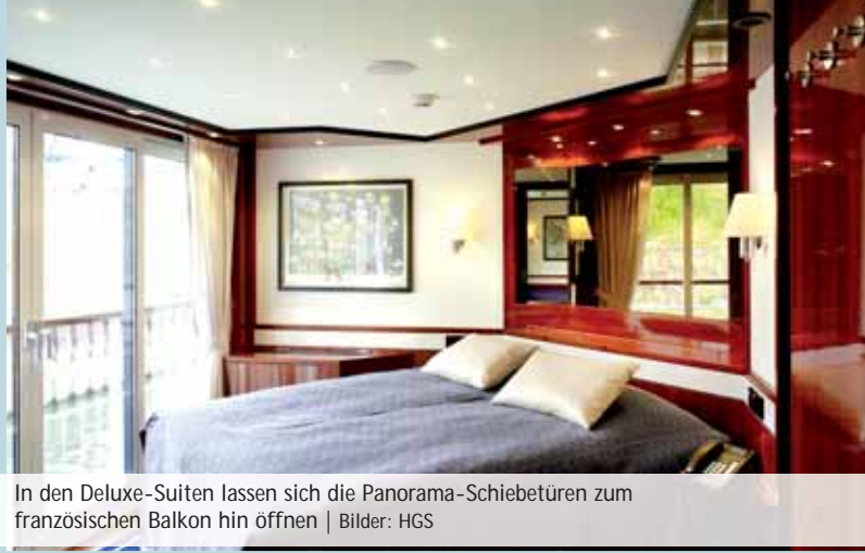
In den Deluxe-Suiten lassen sich die Panorama-Schiebetüren zum französischen Balkon hin öffnen

pool, Duschtempel, Kneipp-Fußbad sowie Fitnessgerät. Hier werden auch unterschiedliche Anwendungen und Massagen angeboten. Im vorderen Bereich des mit Teak belegten Sonnendecks bietet ein gläsernes Windschott eine großzügige Sicht. Große Sonnenschirme schützen die Sitz- und Liegeplätze. Auf dem hinteren Teil des Decks befinden sich Freizeit- und Spielmöglichkeiten wie Putting Green, Shuffle Board, Schachbrett und eine Tai Chi-Fläche.