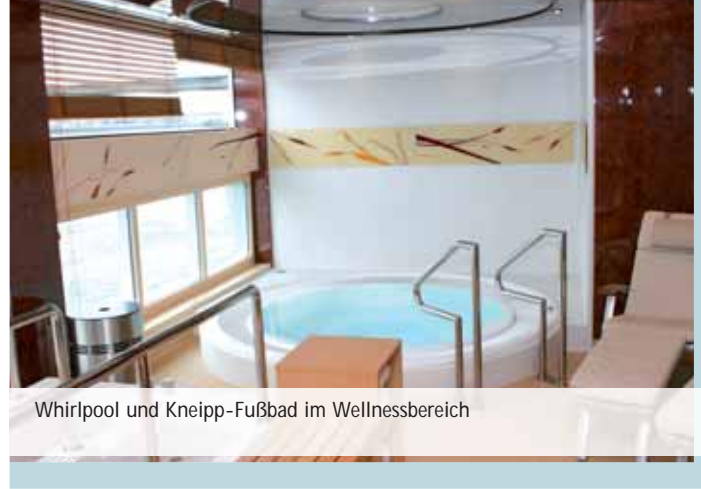
Whirlpool und Kneipp-Fußbad im Wellnessbereich

Zum Manövrieren ist im Vorschiff ein Schottel Pump-Jet vom Typ 82 RD untergebracht. Dieser wird von einem DEUTZ-Motor des Typs BF8M 1015MC mit 440 kW über ein TwinDisc-Getriebe, Typ MG 5114 SC, angetrieben. Des Weiteren ist im Vorschiff ein Not- bzw. Hafendiesel von DEUTZ, Typ BF6M1013MC mit 139 kW eingebaut. Der große Strombedarf auf dem Luxus-schiff erfordert auch entsprechende Stromerzeuger: Im