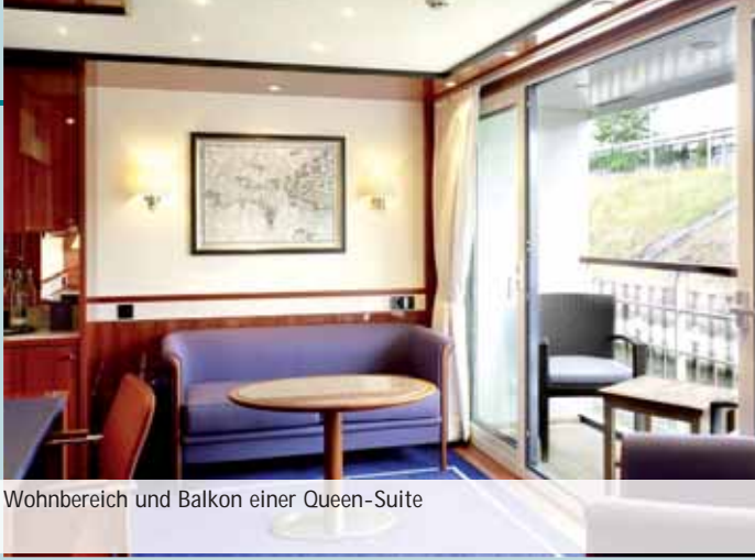
Wohnbereich und Balkon einer Queen-Suite