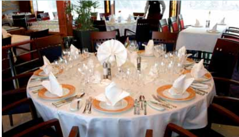
Stilvolles Ambiente herrscht auch in den öffentlichen Räumen vor

Die 30 Junior-Suiten mit je 18 qm und die 16 Deluxe-Suiten verfügen zudem über Panoramafenster und eine Loggia mit französischem Balkon. Eine Glasschiebetür trennt das mit Marmor ausgekleidete Bad vom Kabinenbereich. In den Deluxe-Suiten mit 22 qm Grundfläche sind die Betten schräg im Raum angeordnet, die Sitzgruppe wird durch ein Sofa ergänzt, im Bad sind Waschbereich und Dusche größer dimensioniert. Die vier Queen-Suiten verfügen auf 32 qm